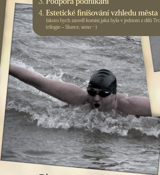
Plavání před zámrazem

4. Estetické finišování vzhledu města (skoro bych zavedl komisi jaká byla v jednom z dílů Troškovské trilogie – Slunce, seno ...)