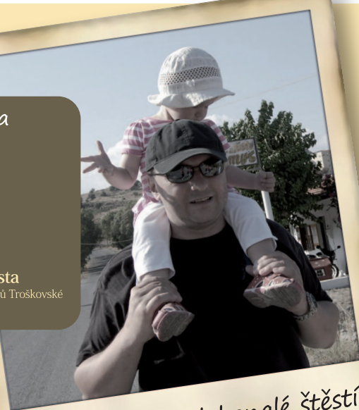
.... dokonalé štěstí.