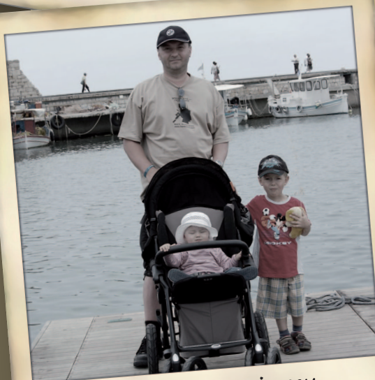
Nejlepší sport je sex