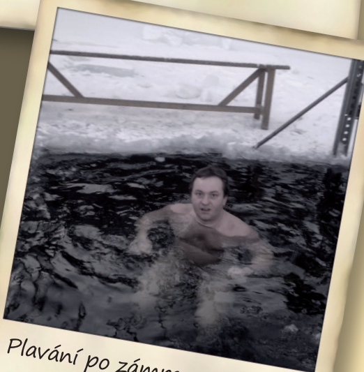
Plavání po zámrazu