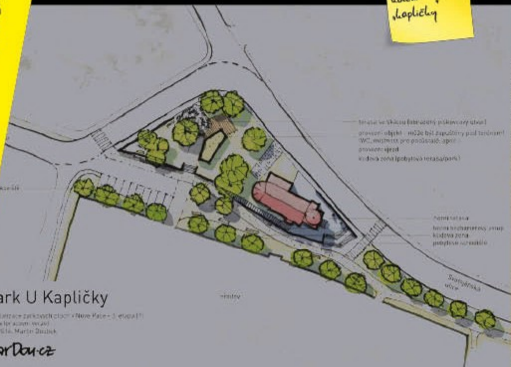
park U Kapličky

Realizační projektová část - Nové Páky - 3. etapa (1) stavba pro záměr: 04/2015 08/2016, Martin Doubek