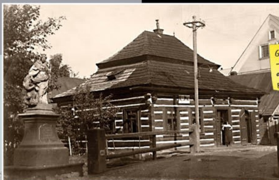
Gernatův dům – historická a současná podoba