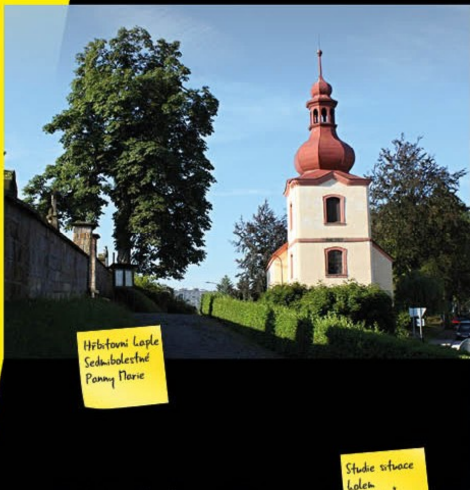
Hřbitovní kaple Sedmibolestné Panny Marie