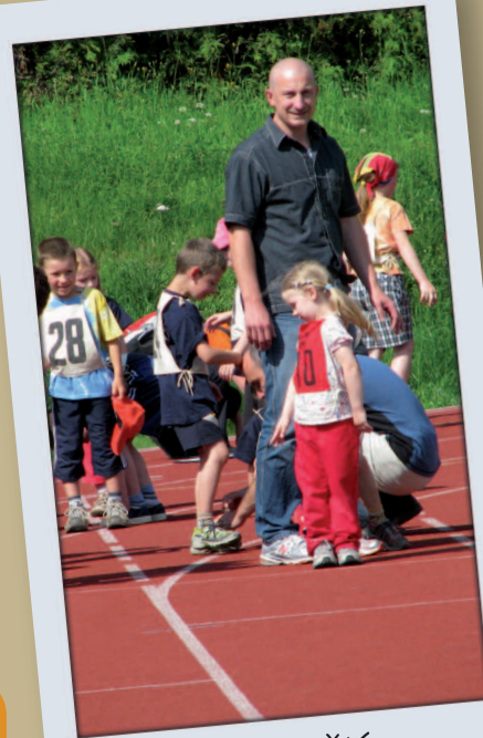
Startovní napětí na sokolské olympiádě.

Se stejnou myšlenkou jsme zahajovali projekt Slovany - západ zaměřený na rodinnou výstavbu. Oběma projektům bych se rád věnoval i v příštím volebním období.