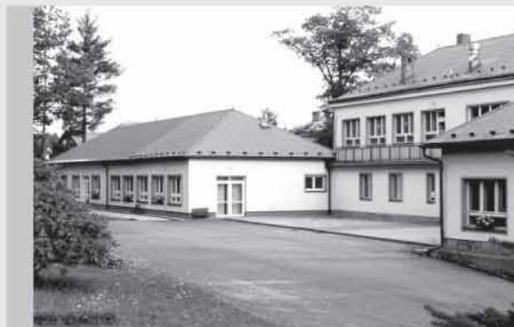
II. MŠ nad poštou, která byla v letech 2004 až 2005 rozšířena a komplexně zrekonstruována za 18 mil. Kč.

Město Nová Paka v oblasti školství nefinancuje pouze investice; jako zřizovatel platí i provozní výdaje těchto zařízení. V posledních letech došlo k navýšení těchto prostředků, což školám umožňuje svobodně řešit své rozvojové programy. Město bude nadále nadstandardně podporovat aktivity a iniciativy škol i v oblasti zájmové. Podpořili jsme a podpoříme spoluúčasti všechny úspěšné žádosti o dotace. Srovnávací analýza s ostatními městy podobné velikosti nám ukázala, že výše příspěvku od města na jednoho žáka nás řadí na jejich čelo. Naším cílem je tento trend zachovat i v budoucnosti, protože kvalitní vzdělání považujeme za základ naší prosperity.