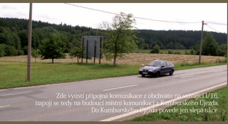
Zde vyústí přípojná komunikace z obchvatu na stávající I/16, napojí se tedy na budoucí místní komunikaci z Kumburského Újezda. Do Kumburského Újezda povede jen slepá ulice.

kteřá zvýhodní občany Nové Paky proti projíždějícím vozidlům. Největší akcí by měla být výstavba kruhového objezdu pod ZPA. Pokud nevzniknou komplikace ve správním řízení, pak reálně tento kruhový objezd postaví a uhradí v roce 2011 firma TESCO, při stavbě marketu na místě dnes již nefunkční čistíčky odpadních vod. Chceme zřídit i další chráněné přechody. Všechna opatření budou mít trvalý charakter a jsou naplánována tak, aby se po vzniku obchvatu staly součástí konceptu bezpečné a bezbariérové dopravy ve městě.