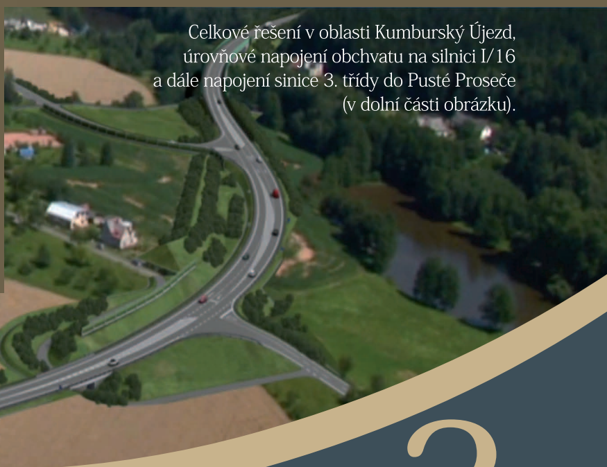
Celkové řešení v oblasti Kumburský Újezd, úrovně napojení obchvatu na silnici I/16 a dále napojení silnice 3. třídy do Pusté Proseče (v dolní části obrázku).