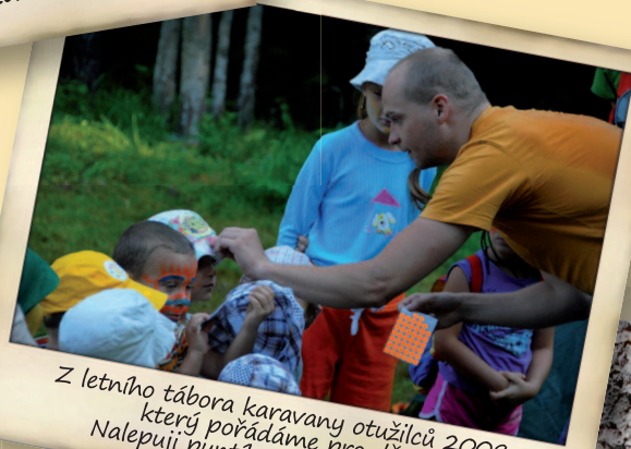
Z letního tábora karavany otužilců 2009, který pořádáme pro děti. Nalepuji puntíky za splněné úkoly.

Jiná forma života v našem nebo jiném vesmíru určitě existuje. Je však otázkou, zda se kontakt uskuteční dříve než naše civilizace zanikne stejně jako ty ostatní, se kterými nyní nemůžeme navázat kontakt.