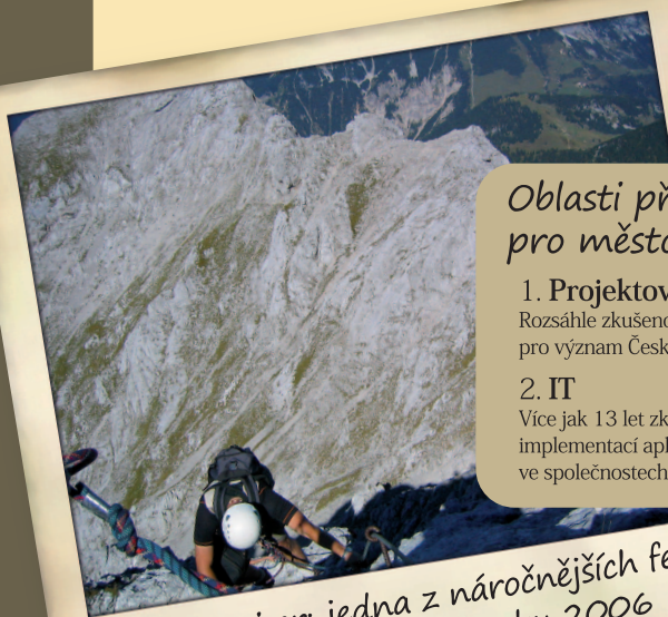
Wilder Kaiser: jedna z náročnějších ferat, při mé dovolené z roku 2006

Velmi mi záleží na férovém a efektivním řízení města. Proto považuji za nejdůležitější opatření proti korupci a vyrovnaný rozpočet. Stabilita a rozvoj města se odvíjí od kvalitních pracovních a podnikatelských příležitostí. Město musí dotáhnout do úspěšného konce průmyslovou zónu, je reálné naplnit ji do konce roku 2014. Jsem vizionář a nebojím se odvážných věcí, proto plně podporuji geotermální elektrárnu, usilujeme o dotaci, pomocí které bychom do 4 let začali se zkušebními vrtem.