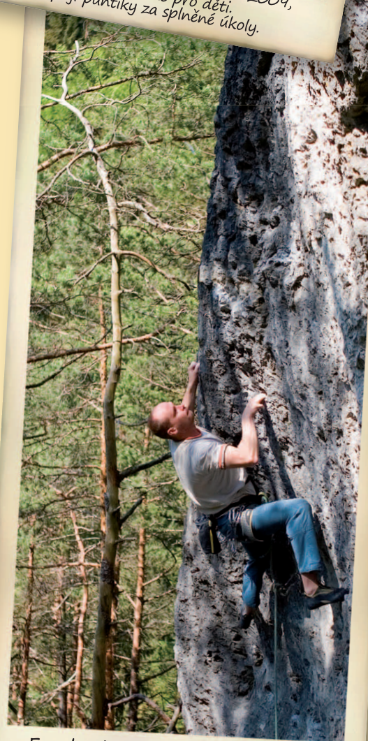
Frankenjura: tato cesta je za 7+ a je v jedné méně známe oblasti. Takže zde nepotkáte mnoho lidí.