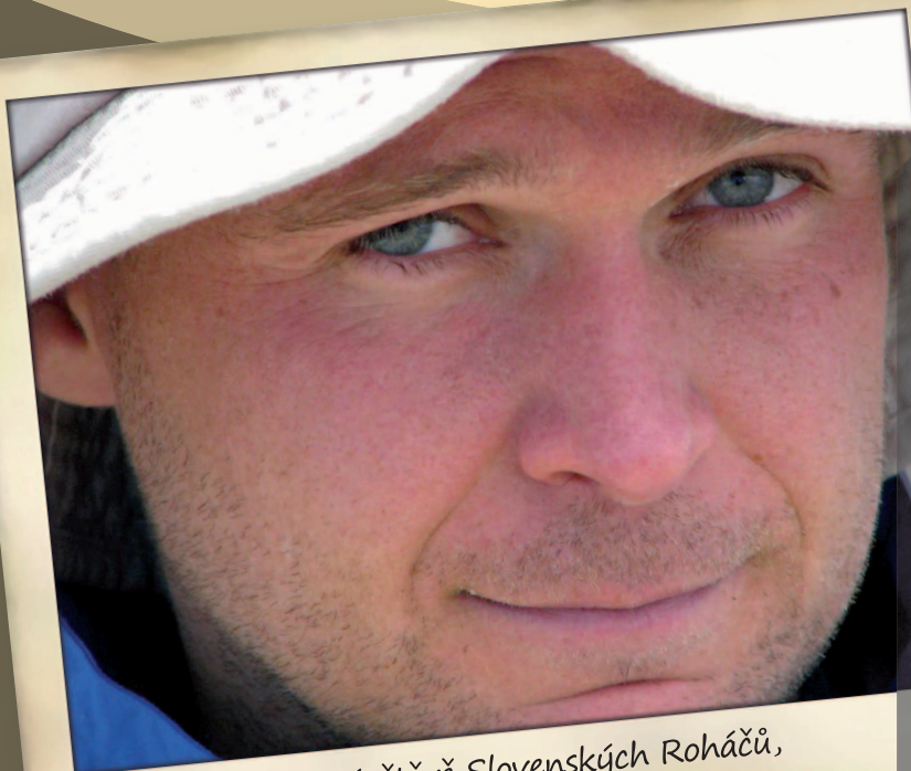
Léto 2008 při návštěvě Slovenských Roháčů, při výstupu na Baranec. Detail při odpočinku.