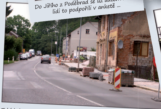
Také kolem cementárny je nová komunikace pro chodce do Vrchoviny.

(s bývalou zeleninou a hernou) je daleko, a tak by o kousek níž, ještě před budovou vodohospodářské společnosti, mělo vzniknout nové, průchozí kryté přístřeší pro čekání. Prostor od Čelakovského až po viadukt se ale musí řešit jako celek, je to poslední nehezký úsek při průjezdu Novou Pakou po silnici I/16. Všechno to bude stát okolo 1 mil. Kč, pro mě je to ale priorita.