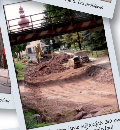
Pod viaduktem jsme nějakých 30 cm ubrali, a hasiči tu už projedou!