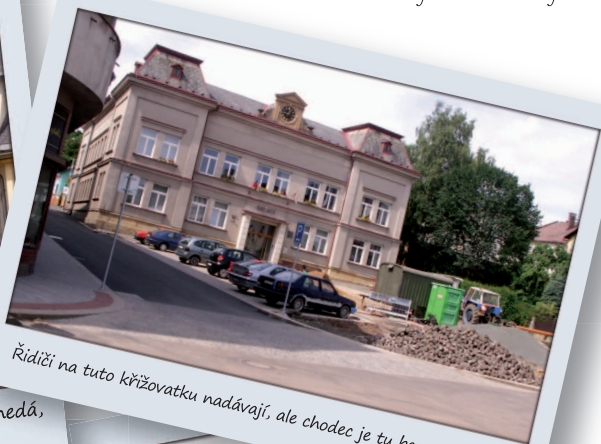
Řidiči na tuto křižovatku nadávají, ale chodec je tu bez problémů.

Pozornost jsme věnovali a budeme věnovat i stávajícím autobusovým zastávkám. Ve Štikově jsou 2 nové budky, také jsme vyjednali úplně novou zastávku (bez budky) Nový Štikov. V Nové Pace teď není žádná vyloženě ošklivá zastávka. Důležitým úkolem je zastávka u polikliniky. Směr do centra je už docela „kulturní“, ale na druhé straně jsou potřeba změny, a to veliké: zastávka by měla být o něco níž, aby nebyla blízko přechodu a křižovatky k Pecce. Současný objekt kryté zastávky