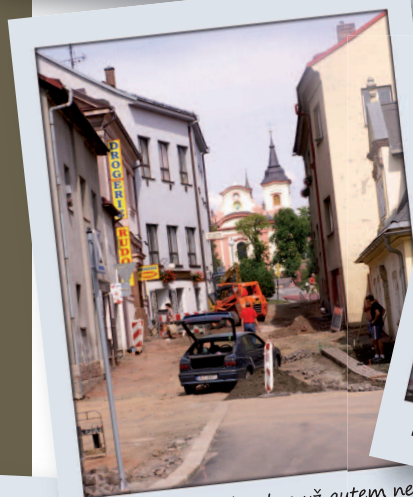
Do Jiřího z Poděbrad se už autem nedá, lidé to podpořili v anketě ...