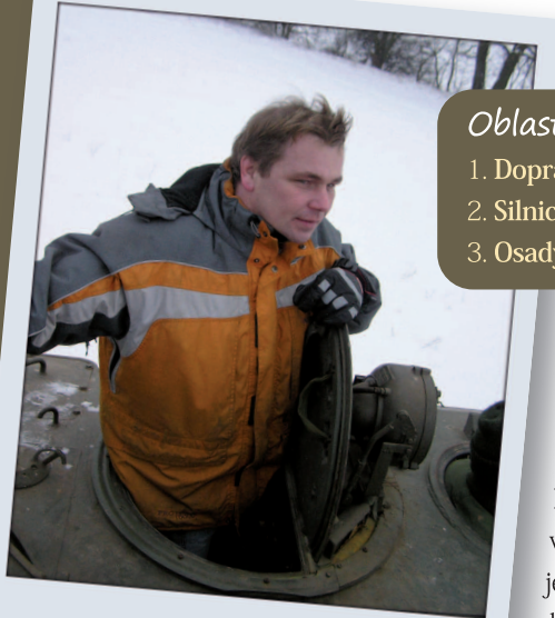
Udržíme správný směr.

Pro mne je nejdůležitější systematická spolupráce s osadami, té jsou Sportovci zárukou. Vidím nutnost výstavby obchvatu, velice podporuji úsilí za další zlepšování silnic a chodníků. Trvám však na vyrovnanosti rozpočtu města. Na to navazuje efektivita úřadu, plavecký bazén by však pro město naší velikosti nebyl luxusem. Podporuji i rekonstrukci MKS v případě dotace.