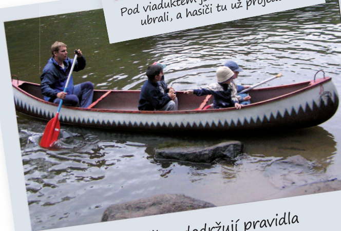
I na vodě se dodržují pravidla