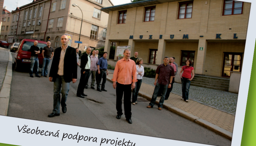
Všeobecná podpora projektu.

pro pokračování: pro interaktivní výukové programy v oblasti geologie, na ty chceme přilákat základní školy z celého Česka. Úprava Muzejního náměstí bude myšlenkově vycházet z ulice Jiřího z Poděbrad a Dukelského náměstí. Silnice s parkovacími místy bude užší a vydlážděná velkými žulovými kostkami. Okolo budou plochy pro pěší pokryté mozaikou. Chtěli bychom tu mít také nějakou fontánu. Bezbariérově upravíme i vstup do přízemí Suchardova domu a okolí araukaritu. Náměstí bude sloužit také jako luxusní vstupní prostor pro MKS.