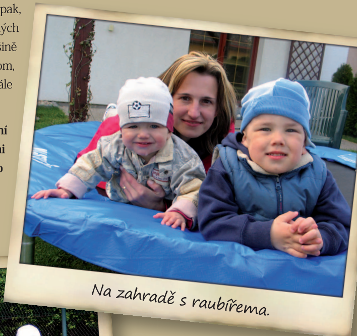
Na zahradě s raubířema.

Ke sportu mám vřelý vztah už od malička. Nejdéle, už od osmi let, hraju tenis. A jestli mi to zdraví dovolí, klidně ho budu hrát, jak se říká, až do osmdesáti... Když napadne sníh, je ze mne náruživý lyžař, sjezdář. Občas také sednu na kolo a s kamarádkami ukrojíme pár kilometrů ze zdejších