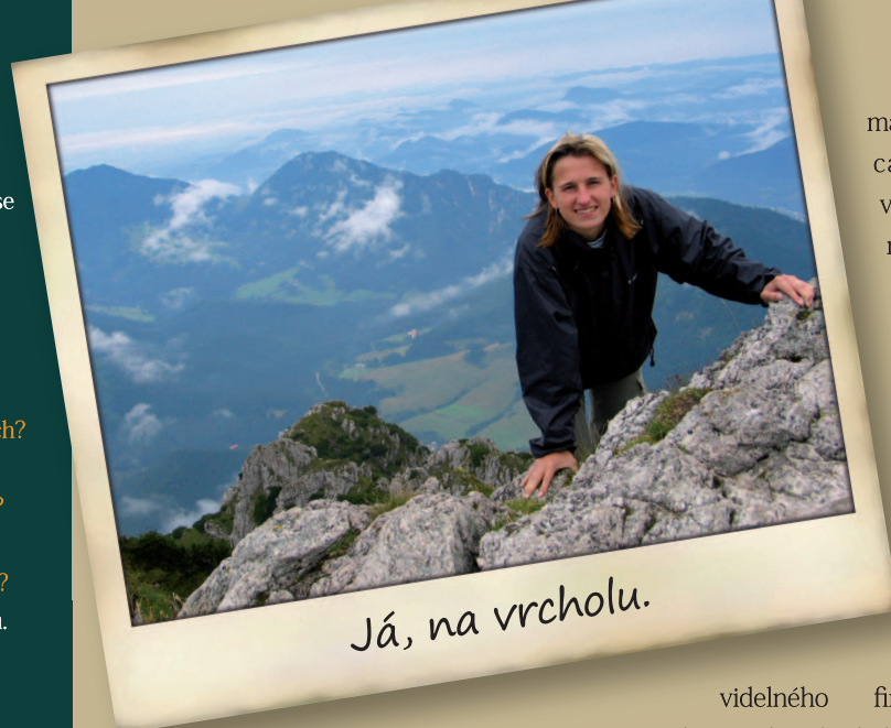
Já, na vrcholu.

V neposlední řadě preferuji výstavbu průmyslové zóny a vyčlenění dostatečného množství finančních prostředků na opravu chodníků a silnic.