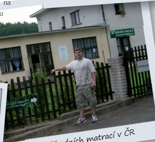
Výrobce přírodních matrací v ČR

bytelného rázu, určené pro zákazníky kteří hledají postel na celý život. Heslo firmy kvalita, luxus, jednoduchost, maximální služby. V první řadě spokojenost zákazníka.