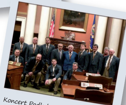
Koncert Podkrkonošské dechovky z Nové Paky v Mall of America USA Minnesota Minneapolis

Pracoval jsem v plastickém průmyslu, kde se z druhotných recyklátů thermoplastů vyráběly polyuretanové pěny, které již obsahovaly stopy karcinogenních látek. Po tomto zjištění se snažím obklopovat pouze přírodními materiály. A tak jsme založili firmu na výrobu přírodních matrací v ČR. Při kompletaci matrací zachováváme ruční výrobu. Není to nic nového, pouze jsme se vrátili k receptům našich dědů a babiček. Základem bylo zvolit ty nejkvalitnější materiály a to byl první problém. V této době málokterá firma vyrobí kvalitní materiál. Hledali jsme tedy firmu, jenž bude naše požadavky splňovat. A našli jsme holandskou firmu Enkev. A požádali ji o představení těch nejlepších materiálů - koňské žíně, kokos, latex. Všechny materiály musí splňovat I. jakost a být maximálně přírodní. V dnešní době se ale za kvalitu platí. Měli jsme tedy strach, zda budou zákazníci naše produkty kupovat. Časem se ukázalo, že v Čechách je mnoho lidí, kteří požadují maximální kvalitu výrobků a služby s nimi spojené. Ostatní materiály odebíráme pouze od výrobců z Čech, kteří se navracují k výrobě přírodních materiálů. Výrobu jsme přesunuli do skromné továrny v Krkonoších v Nové Pace, Šlejharova 36, situované v bývalé prvorepublikové továrně s vilou p. Nýdrleho. Můžete nahlédnout do naší showroom na fotkách http://www.prirodni-matrace.cz Zde jsou vystavené postele z masivu naší jednoduché konstrukce velmi