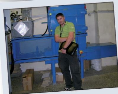
Vlastní konstrukce paketovacího lisu pro Jutu Dvůr Králové