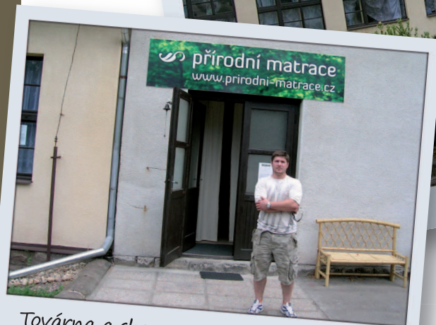
Továrna a showroom přírodní matrace