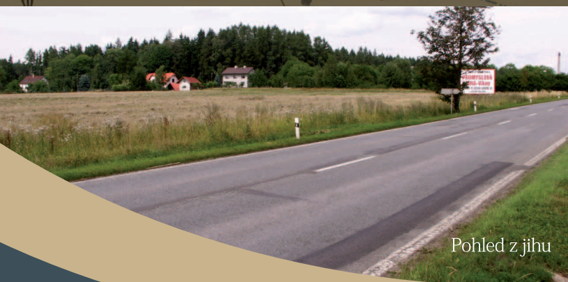
Pohled z jihu

O pozemky v průmyslové zóně je zájem a lze i při pesimistické variantě předpokládat, že poslední bude prodán v roce 2014, do té doby by se městu měla převážná část nákladů vrátit zpět. Zároveň by mělo vzniknout zhruba 200 nových pracovních míst.