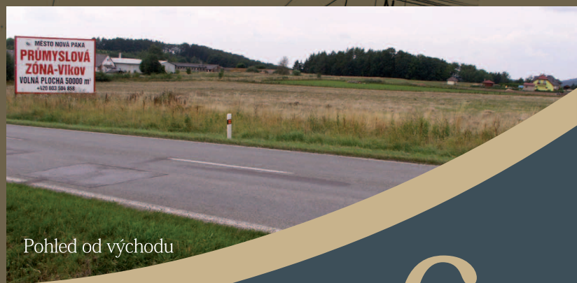
Pohled od východu