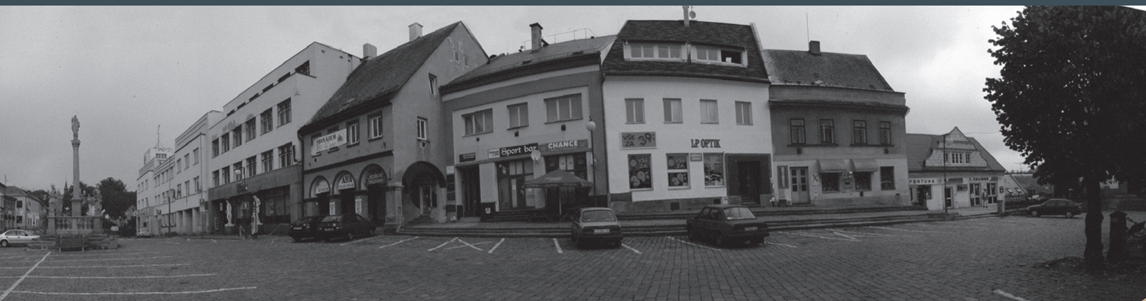
Rozvinutý pohled na náměstí od sochy mistra Jana Husa

Hmota zcela narušuje charakter náměstí - je mimo měřítko a proporce, nerespektuje rytmus dělení původních parcel ani tvar střech okolních objektů. Navíc postrádá loubí, čímž byla přerušena kontinuita loubí po obvodu náměstí. Tento komplex budov na sebe strhává pozornost, kterou by si naopak zasloužili spíše objekty okolo. Dostává se do pohledových os, je bohužel první věcí, kterou člověk spatří vstupuje-li do prostoru náměstí z Komenského ulice. Zbylá část severní fronty je tvořena objekty na původních úzkých parcelách. Pouze jeden z nich má loubí.