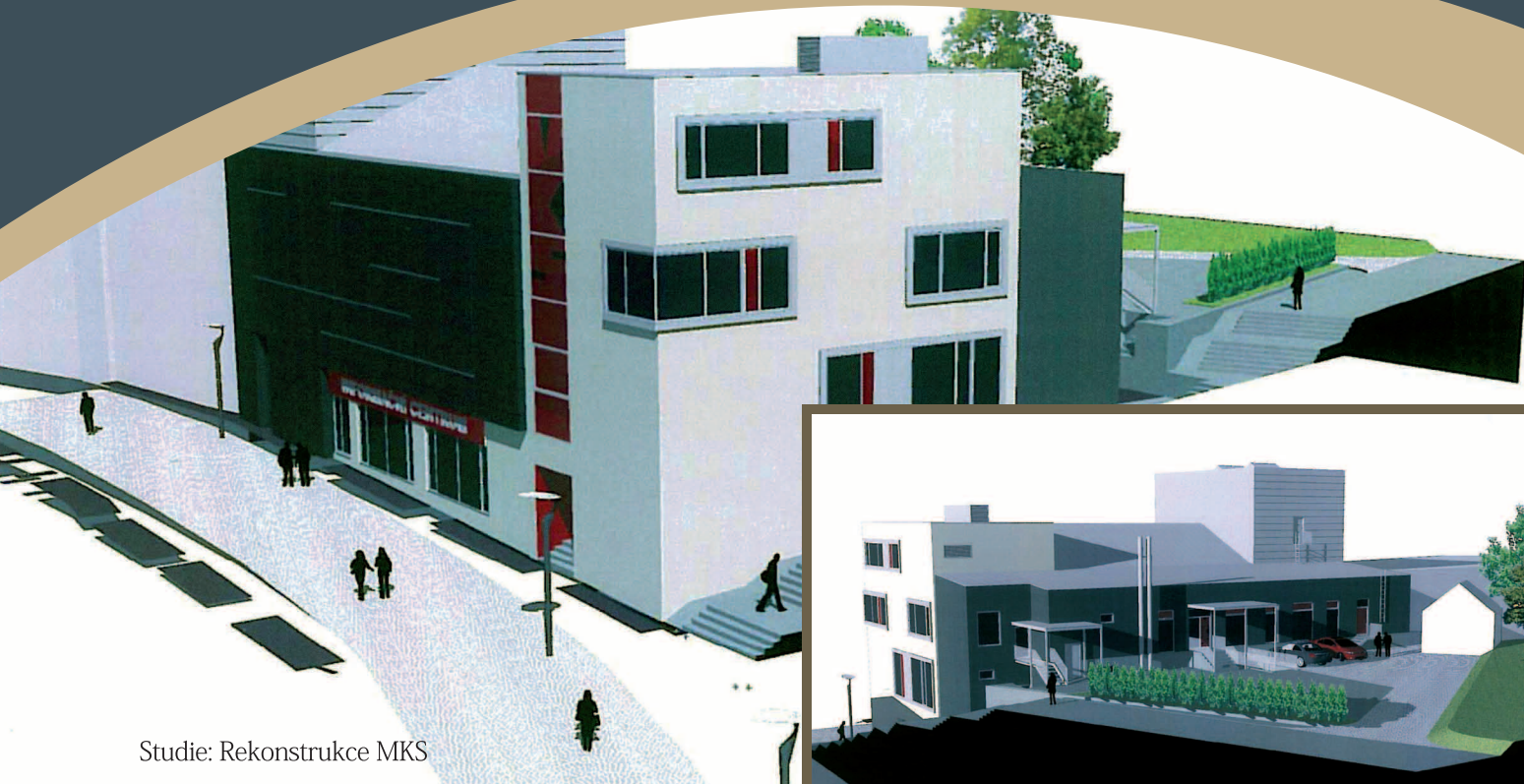
Studie: Rekonstrukce MKS

Jsme si vědomi neutěšeného stavu budovy MKS. Její rekonstrukce patří mezi investiční priority našeho sdružení, ovšem je nutné „na rovinu“ říci, že bez získání dotace se patrně rekonstrukce v nadcházejícím volebním období neuskuteční. Poté, co vybudujeme a zprovozníme krytý plavecký bazén, což je naše jednoznačná priorita, před námi budou dvě velké, finančně zhruba stejně náročné investiční akce. Rekonstrukce centra města a rekonstrukce MKS na multifunkční kulturní zařízení. Pokud budeme muset tyto akce financovat z vlastních zdrojů, tak bychom rádi nechali rozhodnout občany (jak je našim dobrým zvykem), kterou z těchto dvou akcí upřednostní. Anketní otázka by pak mohla být zcela jasná a její výsledek jednoznačně čitelný.