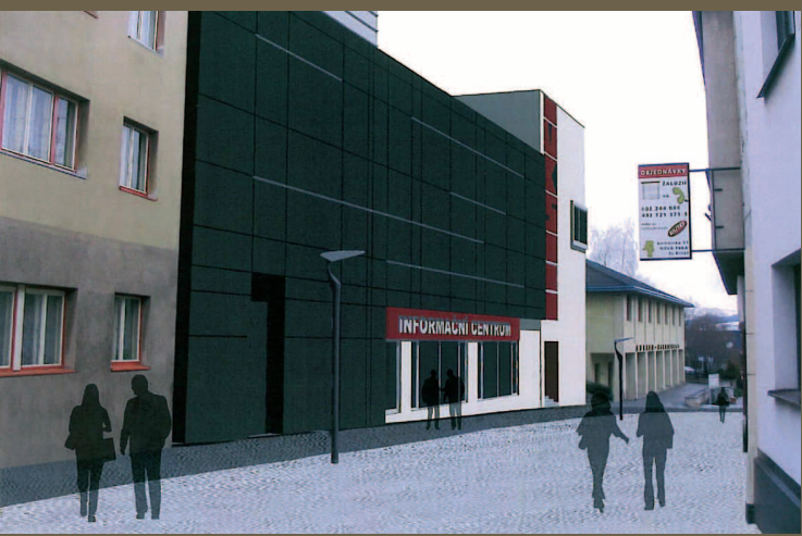
Studie: Rekonstrukce MKS

Závěrem jen částku, kterou by to nás, občany města, stálo. Pokud bychom měli celou rekonstrukci financovat z vlastních zdrojů, jednalo by se o částku 75 – 80 mil. korun, proto uděláme maximum, aby město na MKS získalo dotaci.